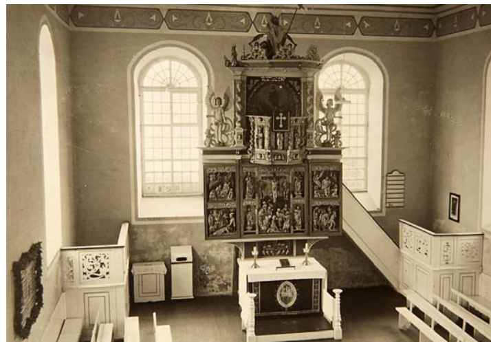
Flügelaltar im Original mit Kanzelaufsatz