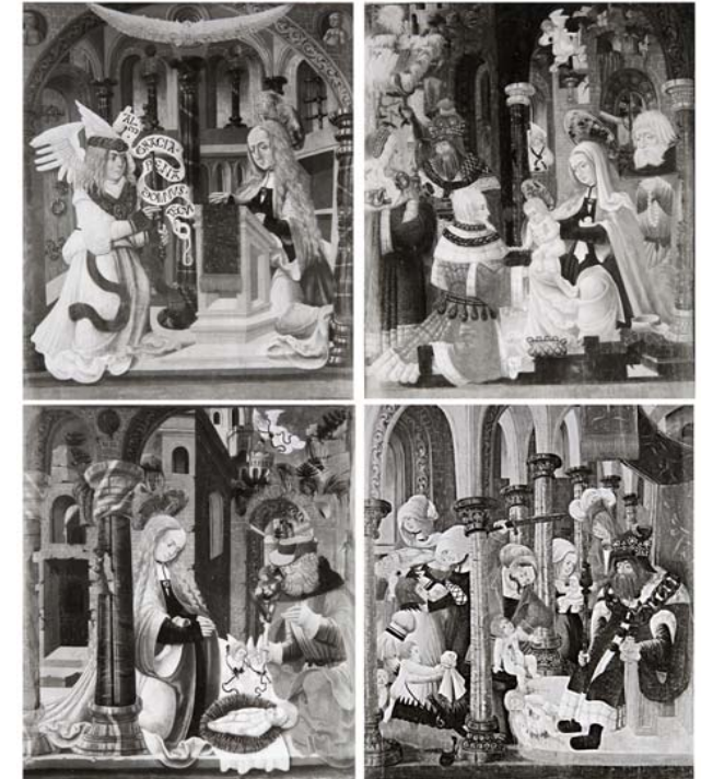
Ansicht des Flügelaltars bei geschlossenen Flügeln

Die Malerei der Flügelaußenseiten stammt unzweifelhaft von einem Maler aus dem Salzburgischen. Dargestellt werden hier vier Szenen aus der Jugendgeschichte Christi. Auf dem linken Flügel oben die Verkündigung an Maria, darunter die Geburt Christi. Auf dem rechten Flügel oben die Anbetung durch die Weisen aus dem Morgenland, darunter der Kindermord zu Bethlehem.