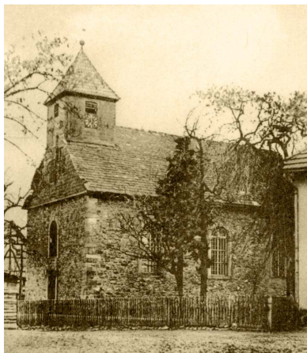
St. Martini Kirche von der Hauptstraße aus gesehen

Aus dem Jahr 1696 stammt der ebenfalls kunstvolle barocke Kanzelaufsatz - von einem Engel getragen. Seit 1981 sind auch die beiden Engel und der mit einer Fahne triumphierende Christus in dem Gotteshaus zu sehen, die einst den Kanzelkorb umrahmten. Bis dahin hatten sie auf dem staubigen Kirchenboden ein weniger hoheitliches Dasein gefristet.