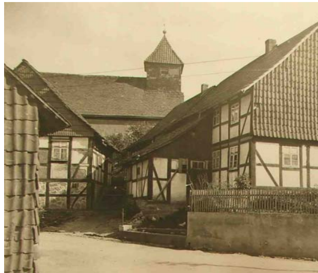
St. Martini Kirche mit ehemaliger Schule von der Ziegenstraße

Herausgegeben von der Ortsheimatpflege Güntersen 2007 © Weitere Informationen zu unserem Ort: www.guentsersen.de